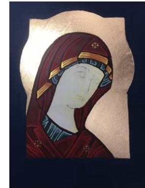
beide Ikonenbildnisse: ©Ursula Zwingenberg.

deines Lebens“ sowie ein offenes Singen mit dem Musiker und Sänger Ralf Schneider.