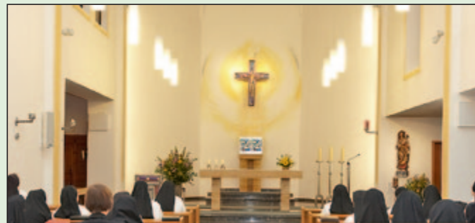
Laudes und Hl. Messe.