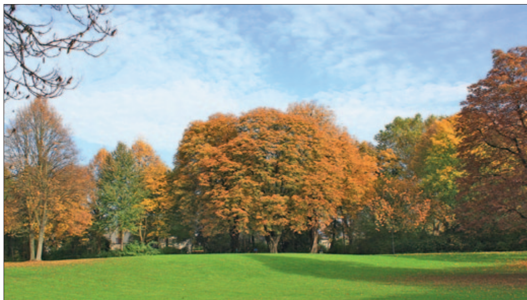
Oftmals gehören gepflegte Parkanlagen zu Abtei oder Kloster – gerade im Herbst mit seinem Farbenspiel der Blätter eine Wonne für die Seele.