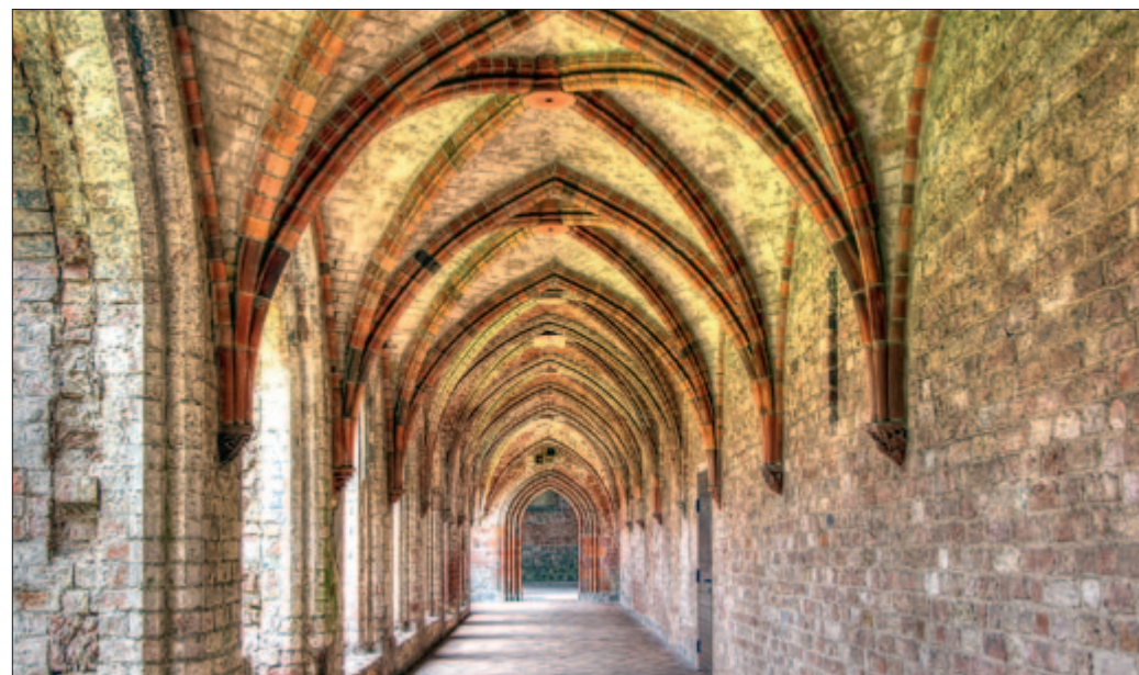
Bereits der Kreuzgang, oftmals zentrales architektonisches Element, strahlt die kraftschöpfende Wirkung eines Klosterurlaubs aus.

Leseräume und eine gut sortierte Bibliothek bieten interessierten Besuchern reichlich Auswahl zum Schmökern. Besonders an Tagungsgäste ist gedacht: Seminarräume