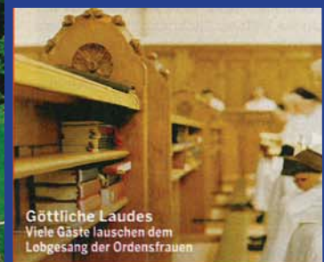
Göttliche Laudes Viele Gäste lauschen dem Lobgesang der Ordensfrauen

Schon die idyllische Lage der meisten Anlagen inmitten von Wiesen und Wäldern sorgt für den heilsamen Abstand zum Alltag. Friedvolle Abgeschiedenheit – hier im Naturschutzgebiet Weltenburger Enge gibt es sie noch. Beinahe schützend legt die