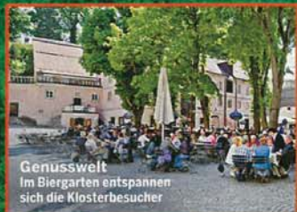
Genusswelt Im Biergarten entspannen sich die Klosterbesucher

sind Orte zum Kraftschöpfen und Besinnen